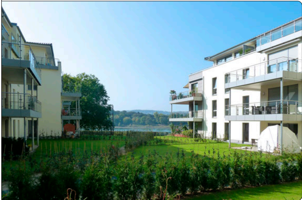
Außenansicht mit Rheinblick

Zwischen Rhein und Siebengebirge wurde 2011/12 im historischen Lemmerzpark Königswinter, wo einst die Fabrikantenfamilie Johann Lemmerz residierte, ein moderner Neubaukomplex mit insgesamt 74 Wohnungen in vier Stadtvillen nach den Plänen des Architekten Jochen Schürtz geschaffen. Die mit hochwertigen Materialien ausgestatteten Wohnungen inmitten einer Parkanlage mit 100 Jahre alten Bäumen erfüllen so gut wie jeden Wohntraum.